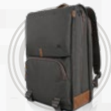
Plecak Urban Backpack B810