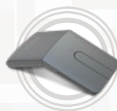
Mysz Lenovo Yoga ze wskaźnikiem laserowym