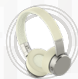
Słuchawki Lenovo Yoga z aktywnym tłumieniem szumów